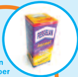
Kleister oder einen guten Alleskleber