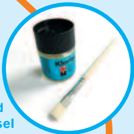
Klarlack und einen Pinsel