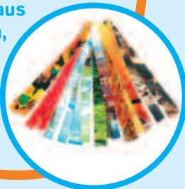
Bunte Seiten aus Zeitschriften, die ihr in 1 und 2 cm breite Streifen schneidet