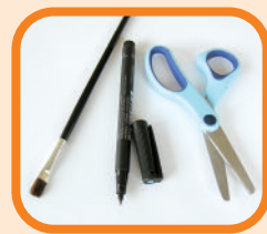
Einen Pinsel, einen schwarzen Filzstift (dünn und wasserfest), eine Schere