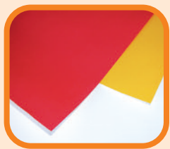
Bastelkarton in Rot, Gelb und Weiß (es geht auch bemalter dünner Karton, z. B. von einer Verpackung)