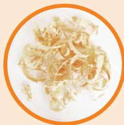
Holzspäne, Heu oder Holzwolle (z. B. aus dem Bastelladen)