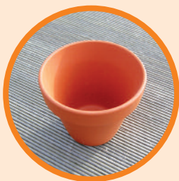
Einen Blumentopf aus Ton (Ø 5–7cm)