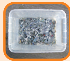
Zeitungsstreifen (sie werden mit etwas Wasser und Tapetenkleister zu Pappmaché eingeweicht).