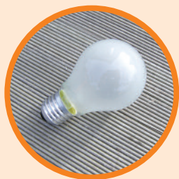
Eine große Glühbirne, die nicht mehr brennt.