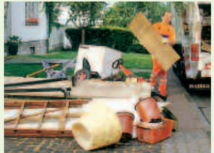
Richtig: So sieht ein typischer Sperrmüllhaufen aus.

Wenn sich bei euch zu Hause ein paar große Dinge angesammelt haben, die ihr nicht mehr braucht, dann rufen eure Eltern bei der FES an. Dort können sie einen Termin zur Abholung vereinbaren. Mit dem Sperrmüll ist es nämlich anders als mit eurem übrigen Abfall. Die Sperrmüllabfuhr muss man bestellen. Das kostet aber nichts extra. Manche Leute denken, man kann die Sachen einfach so vor die Tür werfen. Das stimmt aber nicht.