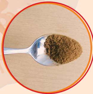
1/2 Teelöffel Zimt (je nach Geschmack auch weniger)