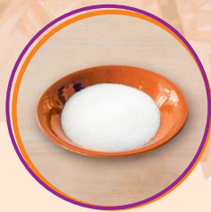
2 Esslöffel Zucker