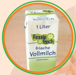
1 Liter kalte Milch