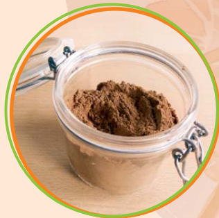
6 Esslöffel lösliches Kakao- pulver (instant)