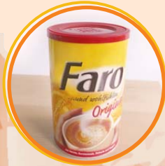
2 Teelöffel Kinderkaffee (kaffeefreier Getreide- kaffee)