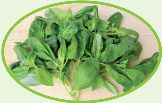
75 Gramm frische Basilikumblätter