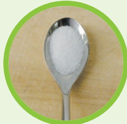
1/2 Teelöffel Salz