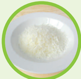
2 Esslöffel frisch geriebener Parmesankäse

Echte Italiener zerreiben dann alles in einem Mörser. Das ist eine schwere Schale, in der man die Zutaten mit einem dicken Stab zerkleinert.