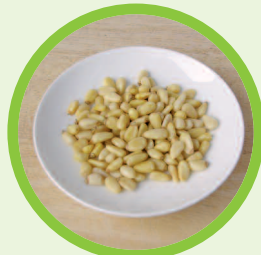
2 Esslöffel Pinienkerne